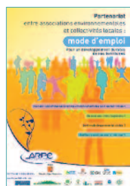
Partenariat associations et collectivités