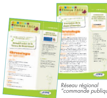
Réseau régional "commande publique"