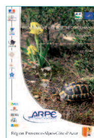
Programme LIFE "Tortue d'Hermann"