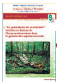
Réseau régional des gestionnaires d'espaces naturels protégés