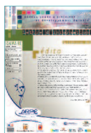
Réseau régional "zones d'activités et développement durable"