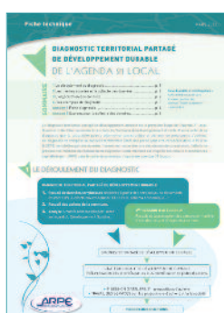
Agenda 21 local