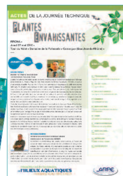
Réseau régional des gestionnaires de milieux aquatiques