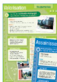
Fiches "Journées techniques d'information et de conseil"